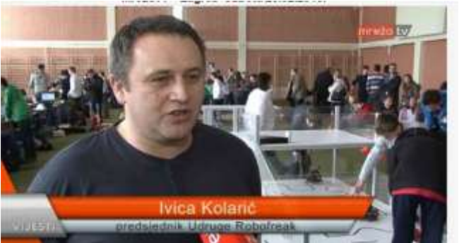
Osim toga za školski sat natjecanje je snimala sisačka ekipa HRT 1 i hrvatski radio za obrazovni program.