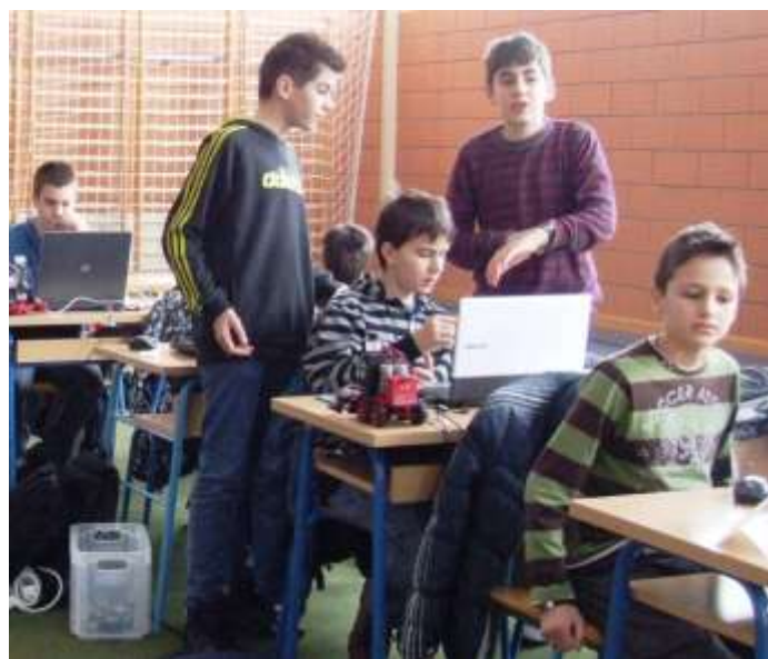
˘Mali zeleni˘, 1.OŠ Varaždin