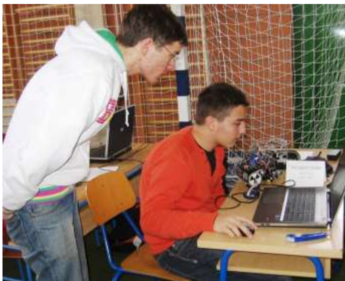
~PETAbot~ V.Gimnazija, Zagreb