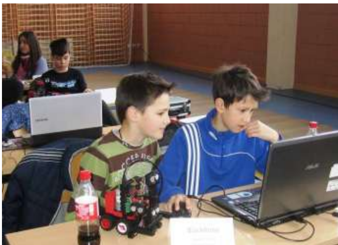
~BlackRobo~, OŠ Budišćina