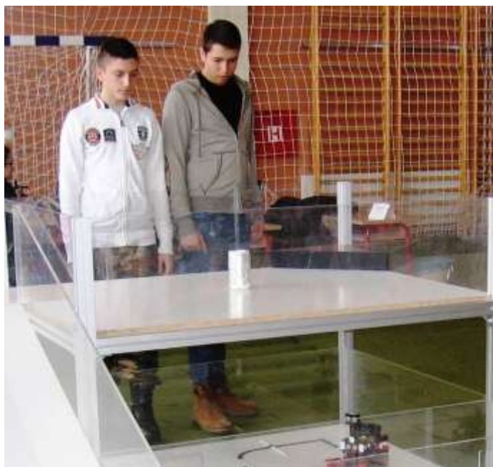
˘Lovrak˘, OŠ M Lovraka